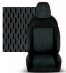
STAR GRIGIO 213