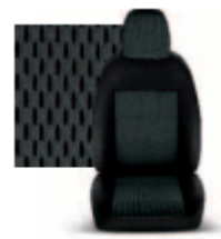
STAR GRIGIO 213