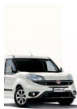
249 - BIANCO

Фарбування кузова пастельною фарбою білого кольору