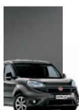
695 - GRIGIO