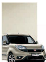
261 - PERLA