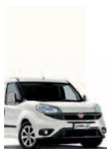
249 - BIANCO