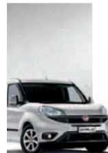
612 - GRIGIO CHIARO