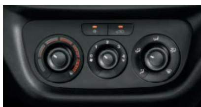
Кондиціонер з ручним регулюванням