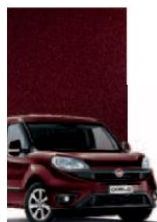
590 - BORDEAUX