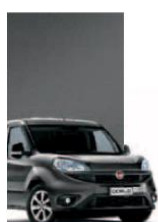
695 - GRIGIO