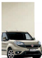
261 - PERLA