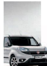
612 - GRIGIO CHIARO