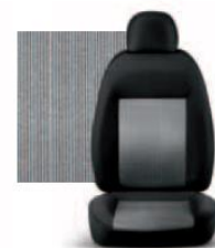
PIN STRIPE GRIGIO 223