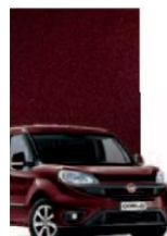
590 - BORDEAUX